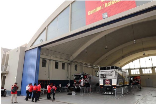
ペルー空軍の基地内で行われた車両検査に臨む日野レンジャー