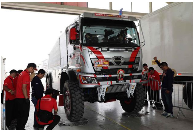
重量チェックのため軸重を測られる2号車