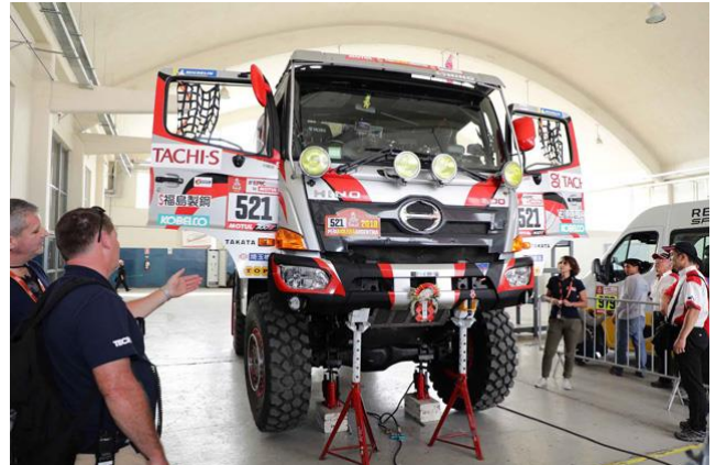
サスペンションストロークを計測される1号車